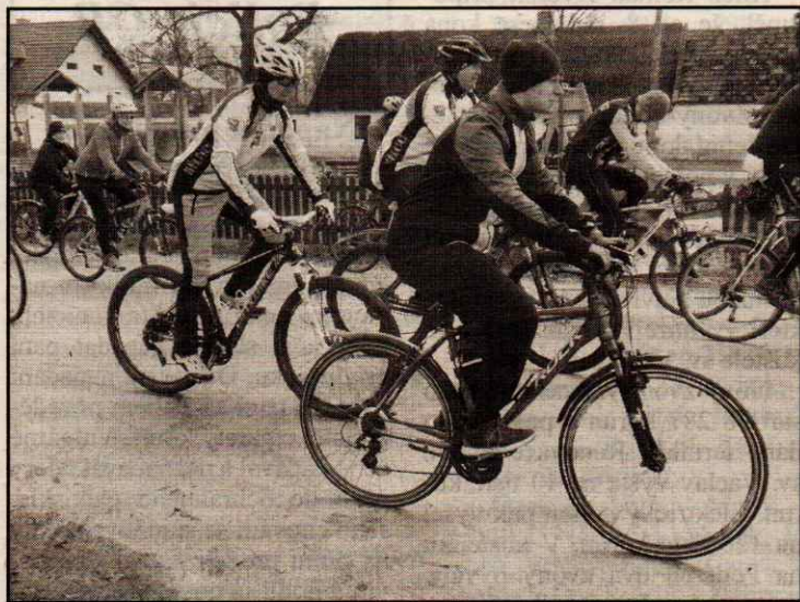
Do Buzic dorazilo přes šest desítek cyklistů, které špatné počasí neodradilo.