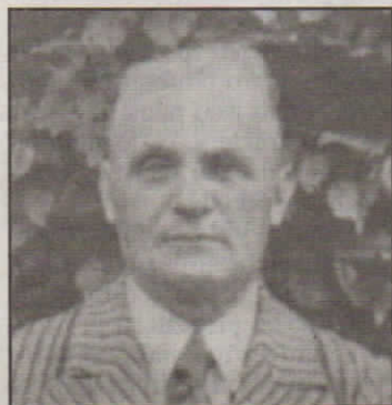
Adolf Arnošt na snímku z roku 1936.