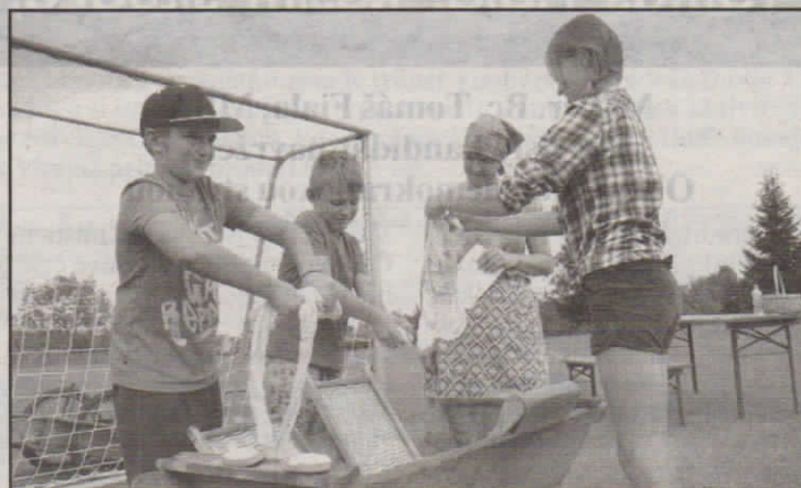
Nejvíce se dětem líbilo praní na valše.

A jak se Loučení s létem rozrostlo za deset let? „První ročník v roce 2011 se konal za pomoci pár mladých sedlických maminek a hodně se improvizovalo, ale akce měla úspěch. V dalších letech už jsme byly schopné zajistit různé rekvizity z DDM ze Strakonice díky paní Aleně Hrdličkové, která tam pracovala. Chyběl nám však personál a hlav-