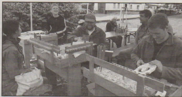
V průběhu víkendu si mohli malí i velcí návštěvníci vyzkoušet šikovnost svých rukou.