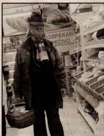
Vyhlášení nouzového stavu a následně karantény nabídlo i tento obrázek z prodejny potravin ve Volyni.